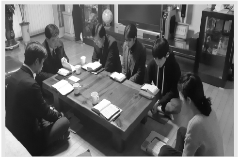
참사랑교회 대심방 현장(3월 첫째 주)