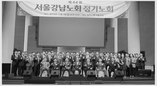
서울강남노회 가을노회 (10.7 임마누엘서교회)