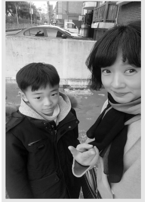
참사랑 현장캠프 모습 (11.25~30)